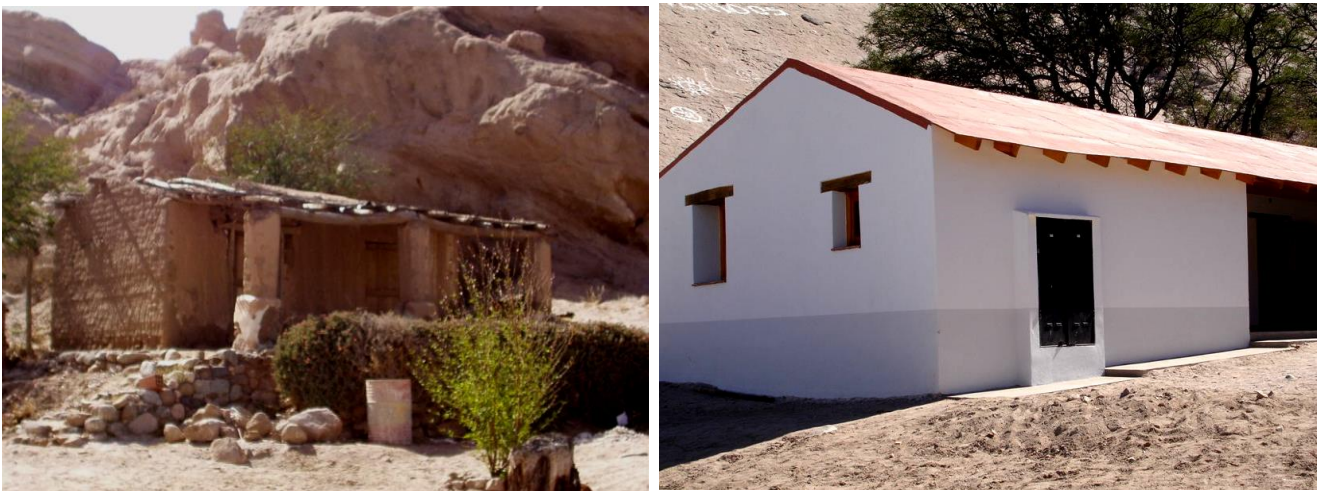
Antes y después de la reconstrucción de la Escuela N.º 4386 de Salta, Argentina, pionera del proyecto

El apoyo local a estas primeras escuelas por parte de los trabajadores de Prosegur en Argentina y el impacto producido en ellas, constituyen el germen de Picitos Colorados: un programa de carácter integral que la Fundación Prosegur profesionalizó y extendió al resto de países de Latinoamérica donde opera nuestra compañía, con la convicción de que la educación es la mejor garantía de futuro.